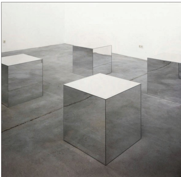
Robert Morris, Brez naslova-Zrcalne kocke/Untitled-Mirrored Cubes , 1965

V tej usmeritvi tudi kiparska dela minimalistov (S. LeWitt, C. Andre, R. Morris, D. Judd in D. Flavin) predstavljajo kiparske konstrukcije, ki niso identificirane s središčem prostora, ampak dobesedno posrkajo in zajamejo obdajajoči prostor. Carl Andre se na primer sklicuje na svoja dela kot »zareze v prostoru«, mase njegovih del valujejo v neločljivi prepletenosti s prostorom. V njegovi instalaciji Eight Cuts (Dwan Gallery, New York, 1967) je razporeditev betonskih elementov zajela celotno galerijsko talno ravnino, razen osmih različno oblikovanih »praznih« enot, ki so razkrile površino spodaj ležečih tal in so utelešale »pozitiv praznine«. Obenem se je okoliška površina zloženih opek obnašala kot diskretno zapolnjena forma, ki je med občinstvom, ki si ni upalo prestopiti praga razstavnega prostora, sprožala vprašanje, »kaj sploh delo je« oziroma »kje se nahaja«.