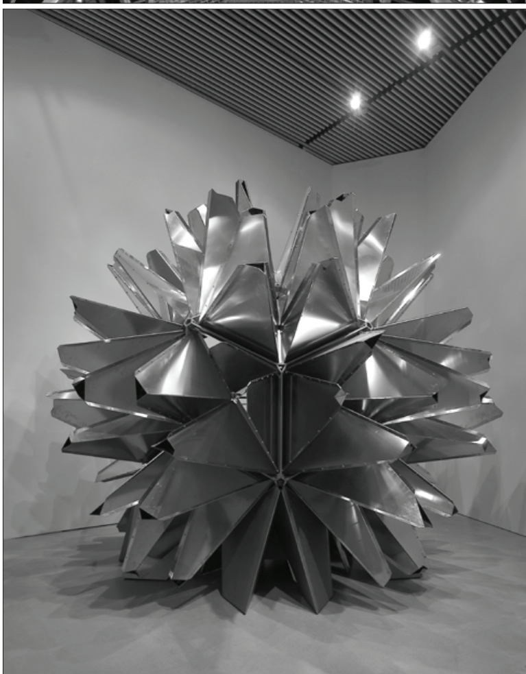
Olafur Eliasson, Multiple grotto , 2004. ARoS Aarhus Kunstmuseum, Danska.

koherentne podobe in samoidentitete lahko sproži občutje posebnega ugodja in sreče v raztopitvi sebe v drugem ali klavstrofobično grozo pred zdrsom v ničnost in praznino.