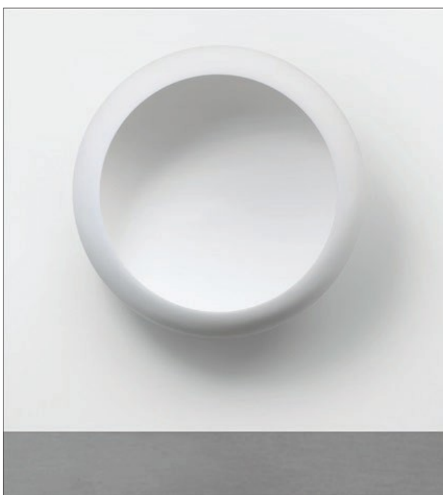
Anish Kapoor, White Dark VIII , 2000

Tudi prostorska, lokacijsko specifična dela Anisha Kapoorja lahko uvrstimo v linijo raziskovanj percepcije skozi tehnologizacijo naravnega. Zaradi formalne izčiščenosti (redukcionizma) in poudarka na »neosebni« estetiki lahko v njegovih