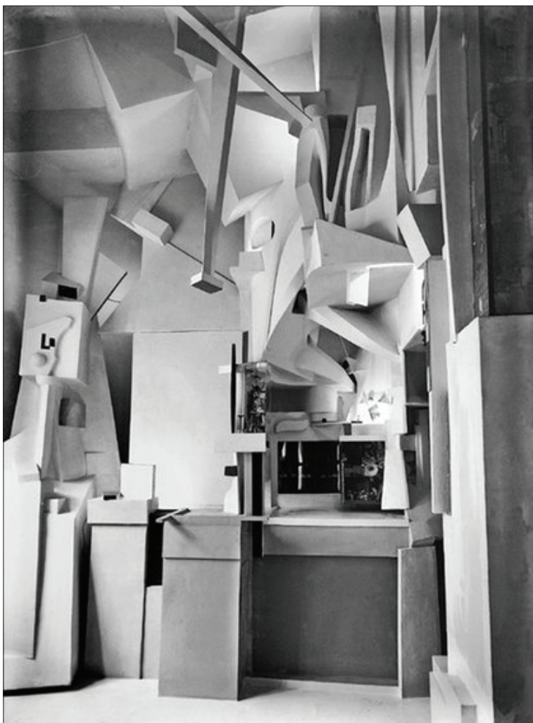
Kurt Schwitters, Merzbau , 1933

iz serije Merzbild 3 (1919–1923) je poudarjal enakovrednost najdenih materialov kot iskanje ravnotežja v dialektiki njihovih lastnosti – uravnotežal je material proti materialu, na primer les proti tkanini, papir proti kovini ipd. V letih 1923–1936 se je obsesivno ukvarjal z gradnjo celostne umetnine ( Gesamtkunstwerk ), ki jo je poimenoval Merzbau . Tako atelje kot bivanjske prostore svoje hiše v Hannoveru je