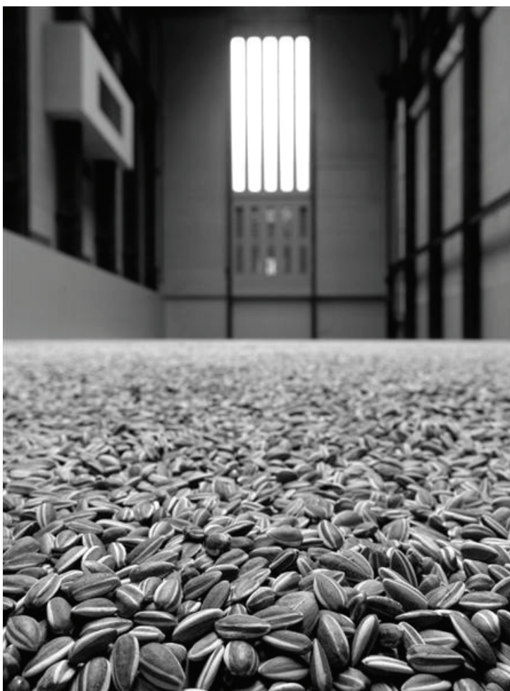
Ai Weiwei, Sunflower seeds , 2010

Instalacija Sunflower Seeds kitajskega umetnika Ai Weiweija (Tate Modern, 2010) ponazarja sodobno prepletenost tehnološkega, simuliranega in realnega. Umetnik je zapolnil velikanski prostor razstavišča z več sto milijoni drobnih porcelanastih sončničnih semen. Čeprav so semena delovala generična, »enaka«, so bila vsa