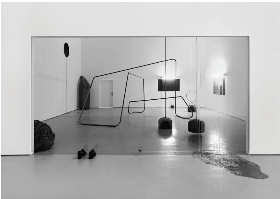
Tatiana Trouvé, The Antechamber , 2009

(Liliana Porter, Edith Dekyndt), raztešeno subjektiviteto in teleprezenco (Mathieu Briand, Roy Ascott), sinestetične in libidinalne nagibe (Christian Jankowski, Tony Oursler). Z osredinjanjem na akustične razsežnosti dela, vzpostavljanjem meditativnih ter spremenjenih čutno-zavestnih stanj in raziskovanjem večdimenzionalne izkušnje hiperprostora (Ryoji Ikeda, Carsten Nicolai, Tatiana Trouvé, Jeremy Shaw) širijo meje zaznavnega in vzpostavljajo nove oblike telesno mentalnega izkustva gledalca.